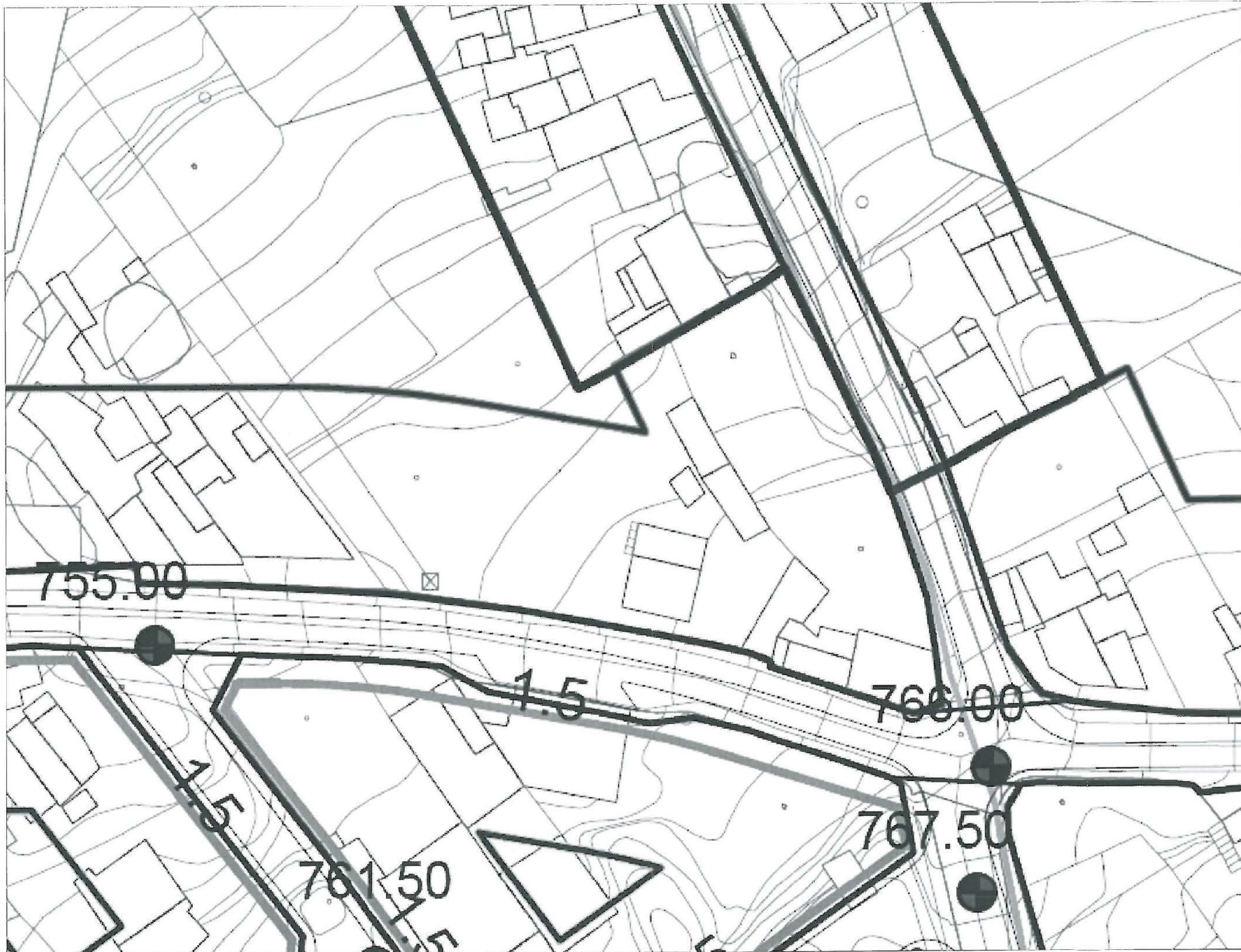
PLANO DE ALINEACIONES