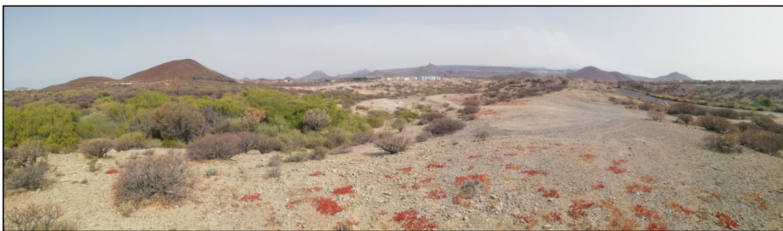
Figura 3: Aspecto del ámbito muestreado en la Hoya de la Morra Grande.

La Hoya de la Morra Grande, con coordenada de referencia 28R 340500/3102500, se trata de un terreno de 524.717 m 2 y referencia catastral 0726401CS4002N0001QL. Se encuentra situado a 110 m s.n.m. entre el extremo sur del Polígono Industrial de Las Chafiras y el complejo turístico Amarilla golf. Es un ámbito donde se combina la presencia de ignimbritas y tobas con malpaíses basálticos. Aparentemente el grado de antropización de esta zona es escaso y en general el suelo y vegetación presentan buen estado de conservación (Fig. 3). La vegetación está dominada por elementos vegetales climatófilos el Tabaibal dulce tinerfeño ( Ceropegio fuscae-Euphorbietum balsamiferae ); Ceropegia fusca (cardoncillo), Euphorbia balsamifera (tabaiba dulce), Kleinia neriifolia , Limonium pectinatum (siempre viva de mar), Neochamaelea pulverulenta (orijana), Periploca laevigata (cornical), Plocama pendula (balo), Polycarpha nivea (saladillo), Schizogyne serícea y Mesembryanthemum nodiflorum . Aunque también se han observado algunos elementos vegetales de carácter invasor como Opuntia dilenii y Opuntia máxima (tunera común).