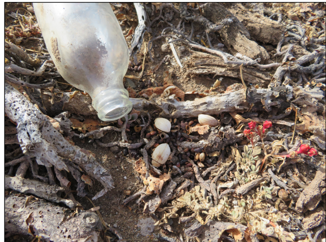
Figura 5. Ejemplares detectados en los muestreos realizados en 2021. A) Ejemplar vivo detectado en Llano del Camello; B) Tres restos de élitros detectados en el interior de una botella en Hoya de la Morra Grande.