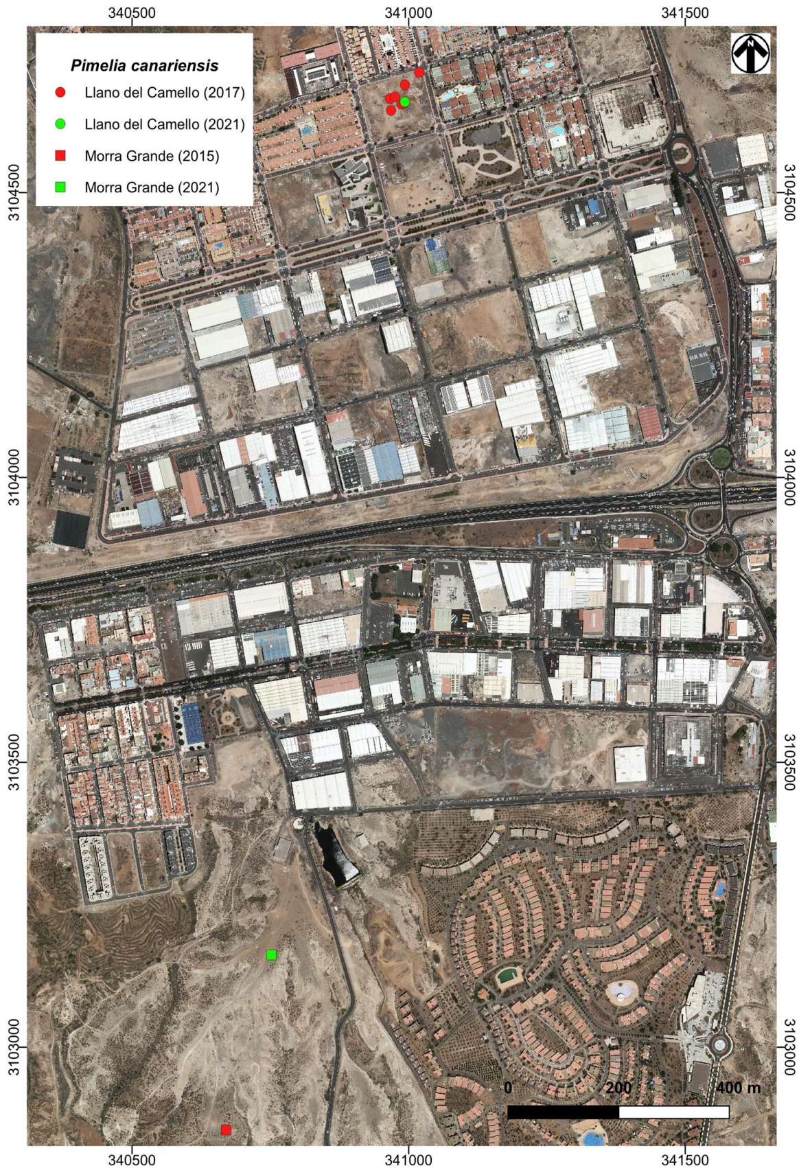
Figura 6. Localización de las citas de Pimelia canariensis en los ámbito prospectados. Llano del Camello: punto rojo citas de 2017 (Morales et al. , 2018) y punto verde citas 2021. Hoya de la Morra Grande: cuadrado rojo citas de 2015 (de la Cruz et al. , 2015) y cuadrado verde citas 2021.