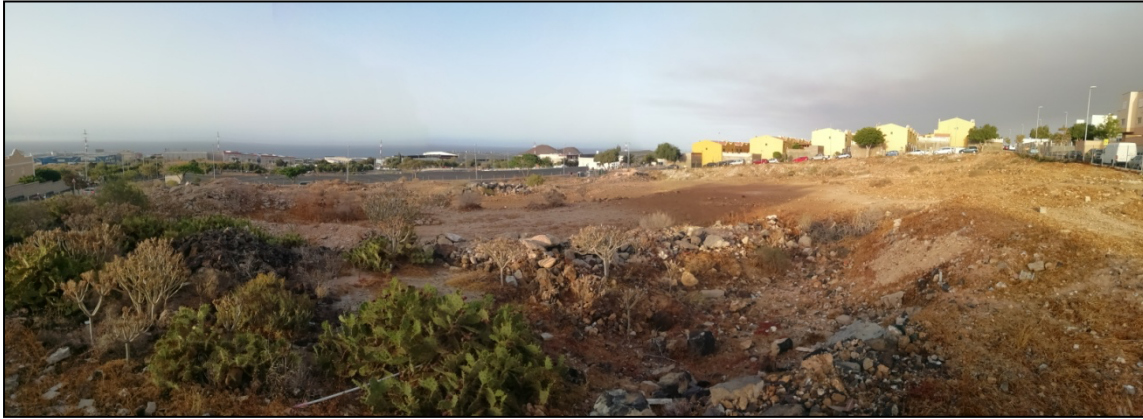
Figura 2. Aspecto del ámbito muestreado en el Llano del Camello.

mascotas, lo que ocasiona un constante movimiento y alteración del suelo. La vegetación presente es rala y en general aporta escasa cobertura vegetal al terreno. Es de marcado carácter antrópico con presencia de algunos elementos climatófilos de vegetación potencial (Fig. 2); Austrocylindropuntia cf. subulata (alfileres de eva), Cenchrus orientalis (rabo gato), Mesembryanthemum nodiflorum (barrilla), Opuntia dilenii (tunera india) y kleinia neriifolia (verode), Launaea arborescens (aulaga), Plocama pendula (balo), Schizogyne serícea (salado).