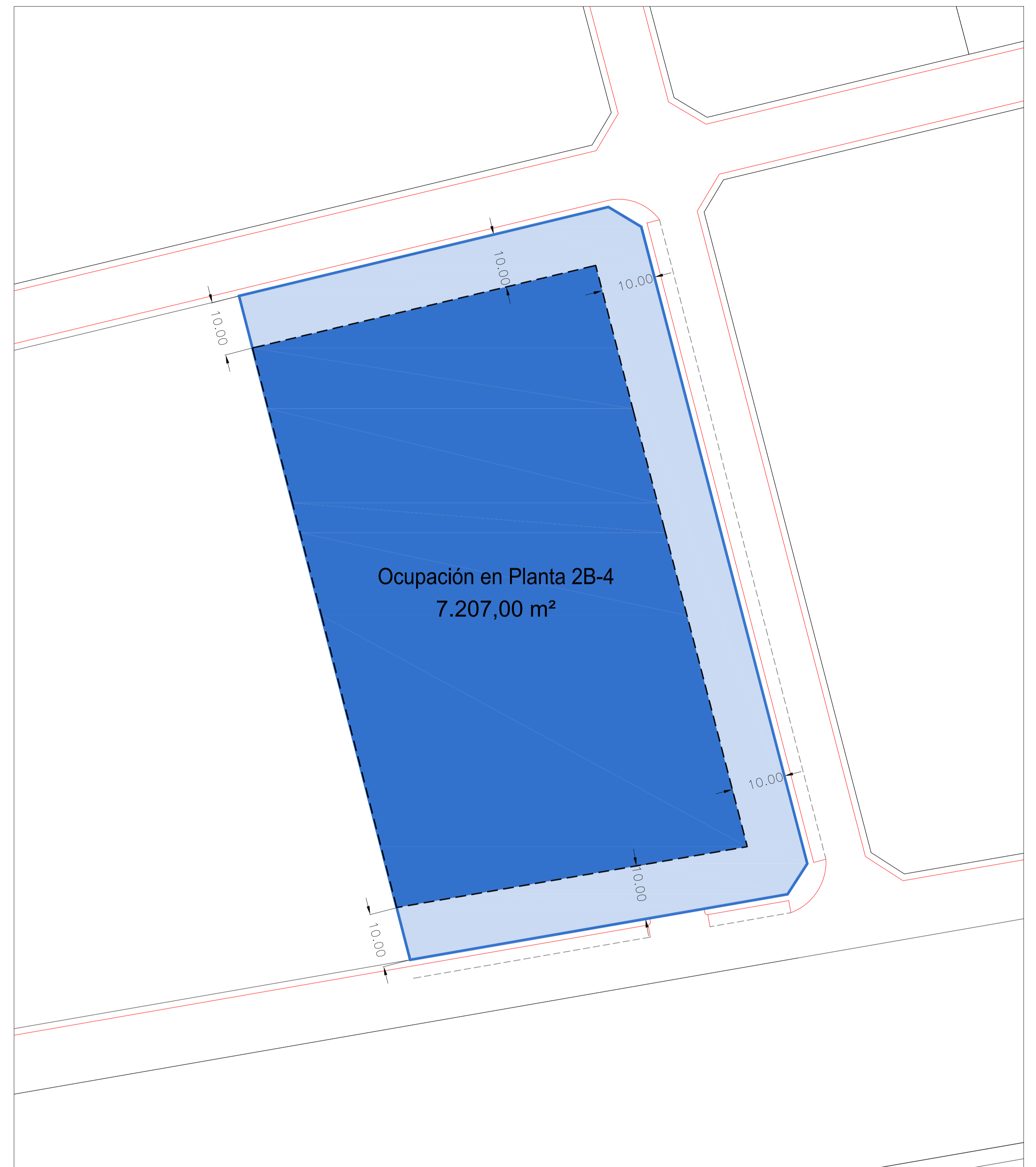
ORDENACIÓN DE VOLUMENES