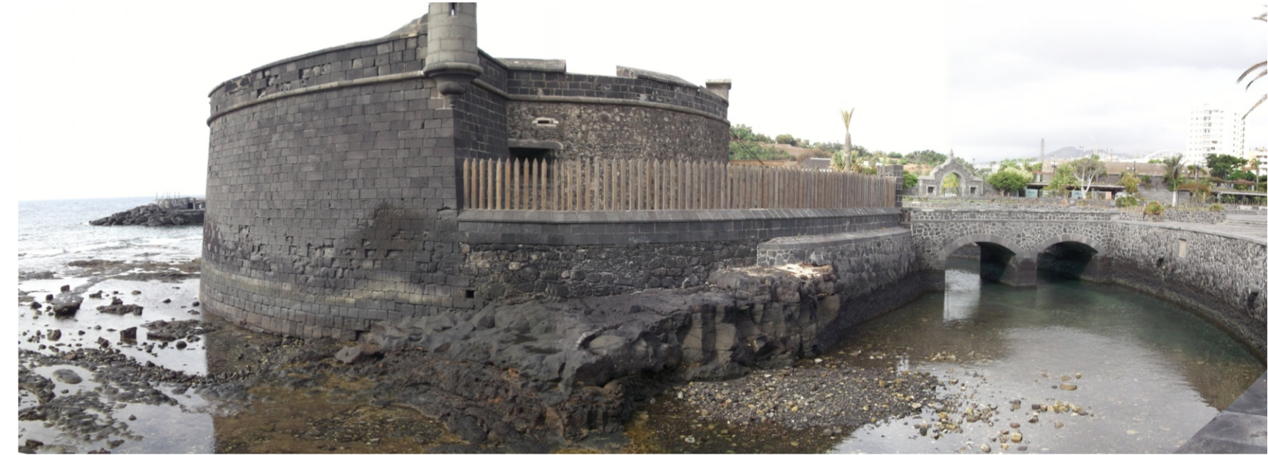
Detalle de la localización del Castillo Negro.