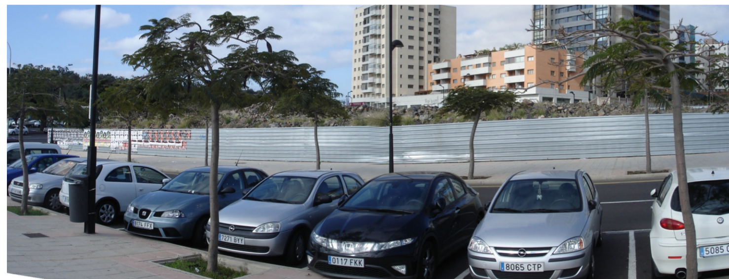
Parcelas con residuos procedentes de desmontes y la especie invasora rabo de gato.