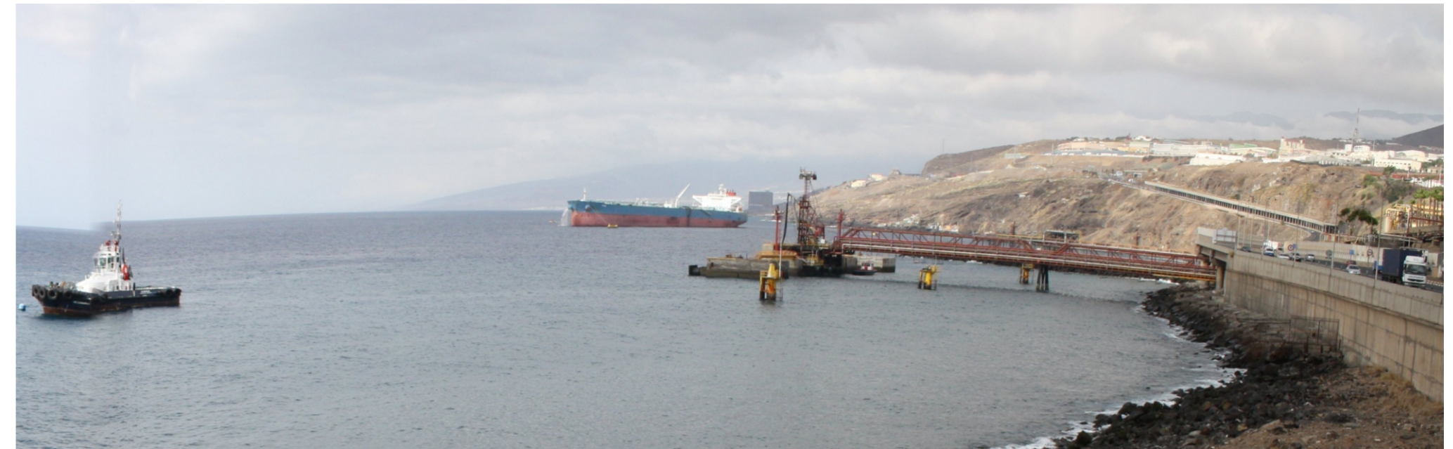
Panorámica donde se observan las infraestructuras para el trasvase de combustible.