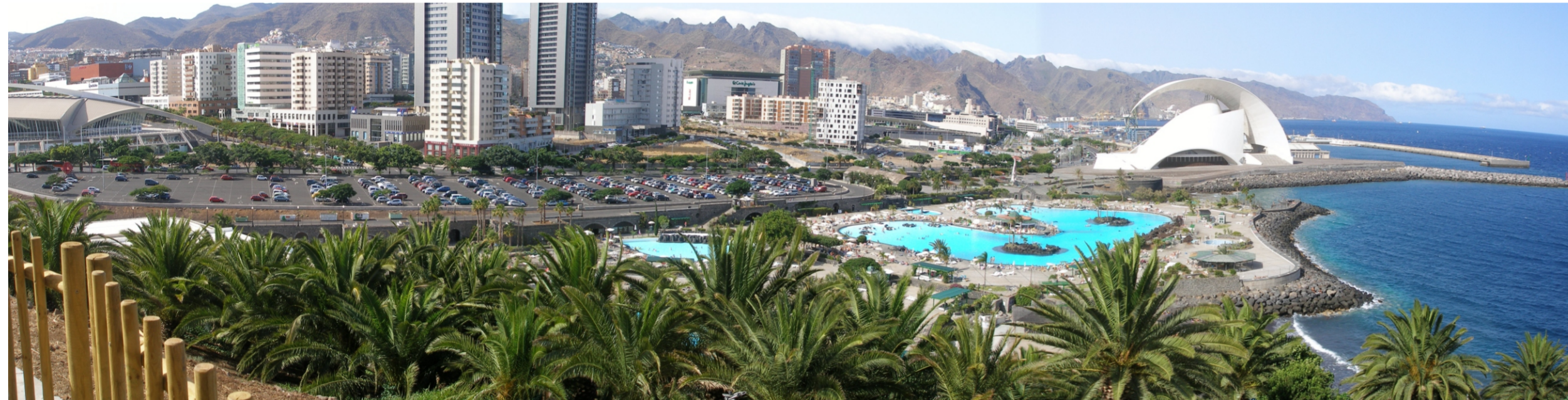
Panorámica tomada desde el Palmetun, desde donde se observan el Parque Marítimo de Santa Cruz, el auditorio Adam Martín y el Castillo Negro (San Juan).