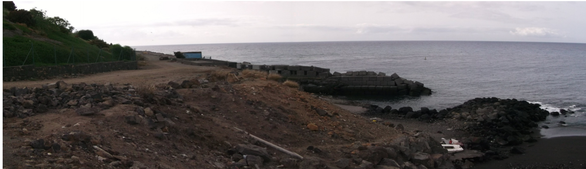
Vista del límite norte del área funcional "La Hondura" con "Parque Marítimo".