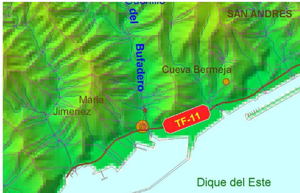
MDT GRAFCAN. Año 2002

Coordenadas UTM (centro vista) X: 379999,8 Y: 3152539