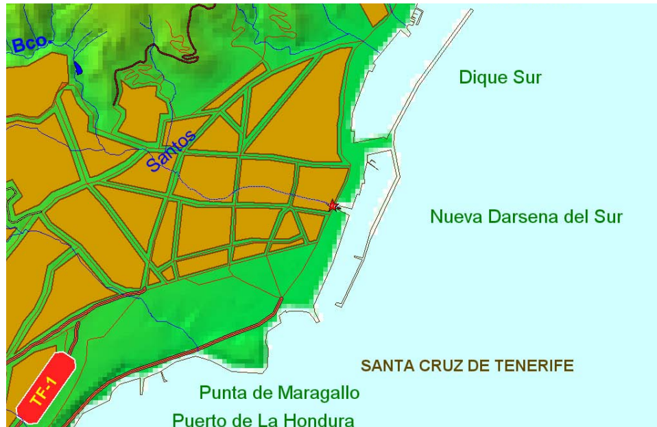
MDT GRAFCAN. Año 2002