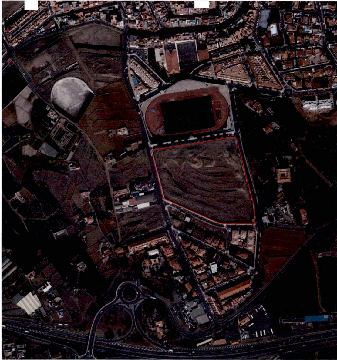
EMPLAZAMIENTO E 1:200