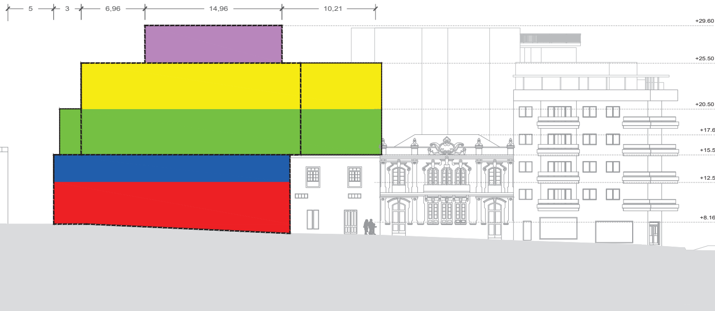
ALZADO-SECCION B-B ( CALLE SAN AGUSTIN DE BETHENCOURT ) E 1/150