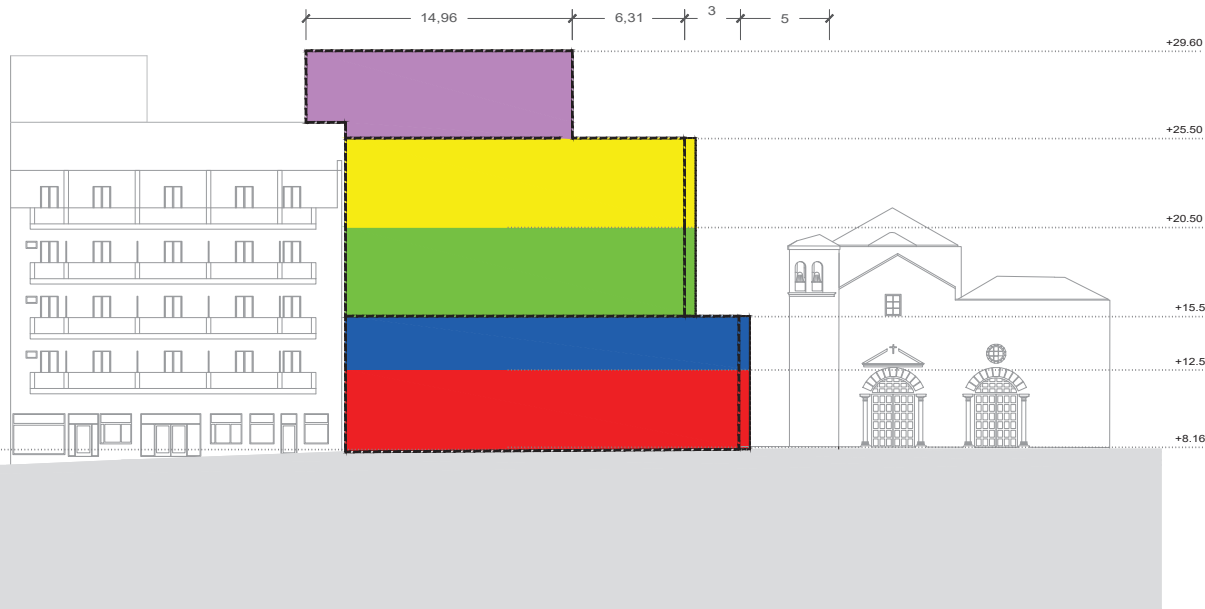
ALZADO-SECCION A-A ( CALLE SAN JUAN ) E 1/150