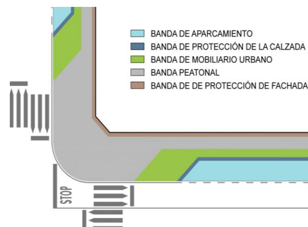
Ejemplo de aplicación de los elementos descritos en el presente documento.