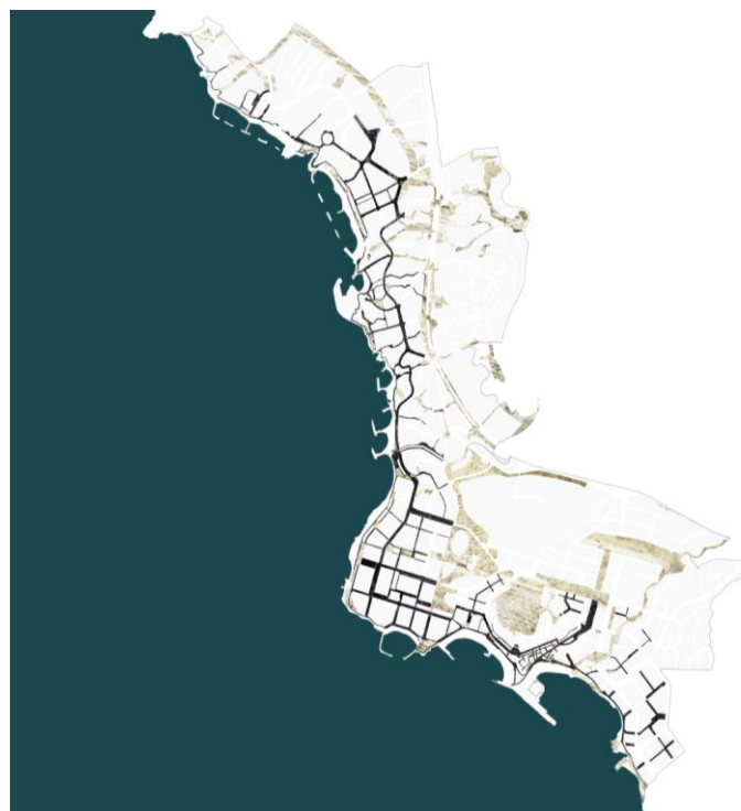
Plano: Esquema de Espacios de Recorrido y Espacios de Estancia – Elaboración: Propia.