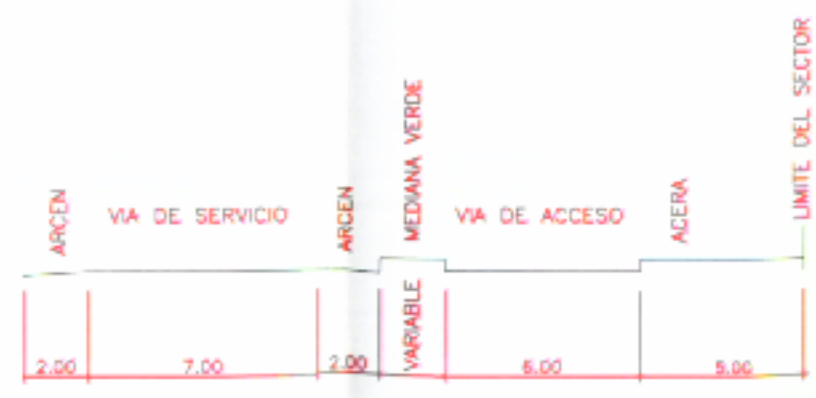
SECCION TIPO DE DESVIO VIARIO DE ACCESO