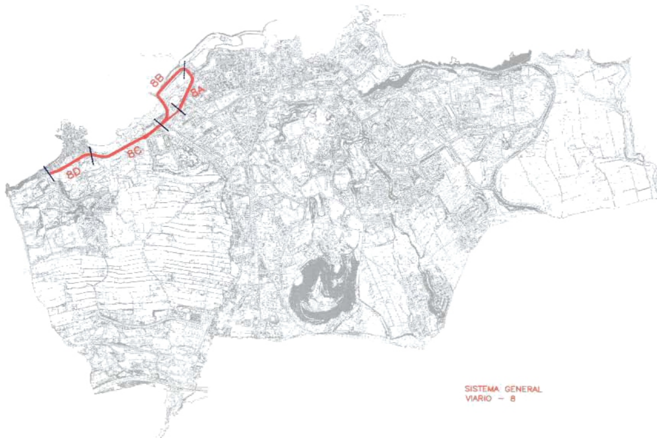
SISTEMA GENERAL VIARIO - 8

8D. —Se obtiene por gestión gratuita y gestión del sector A.