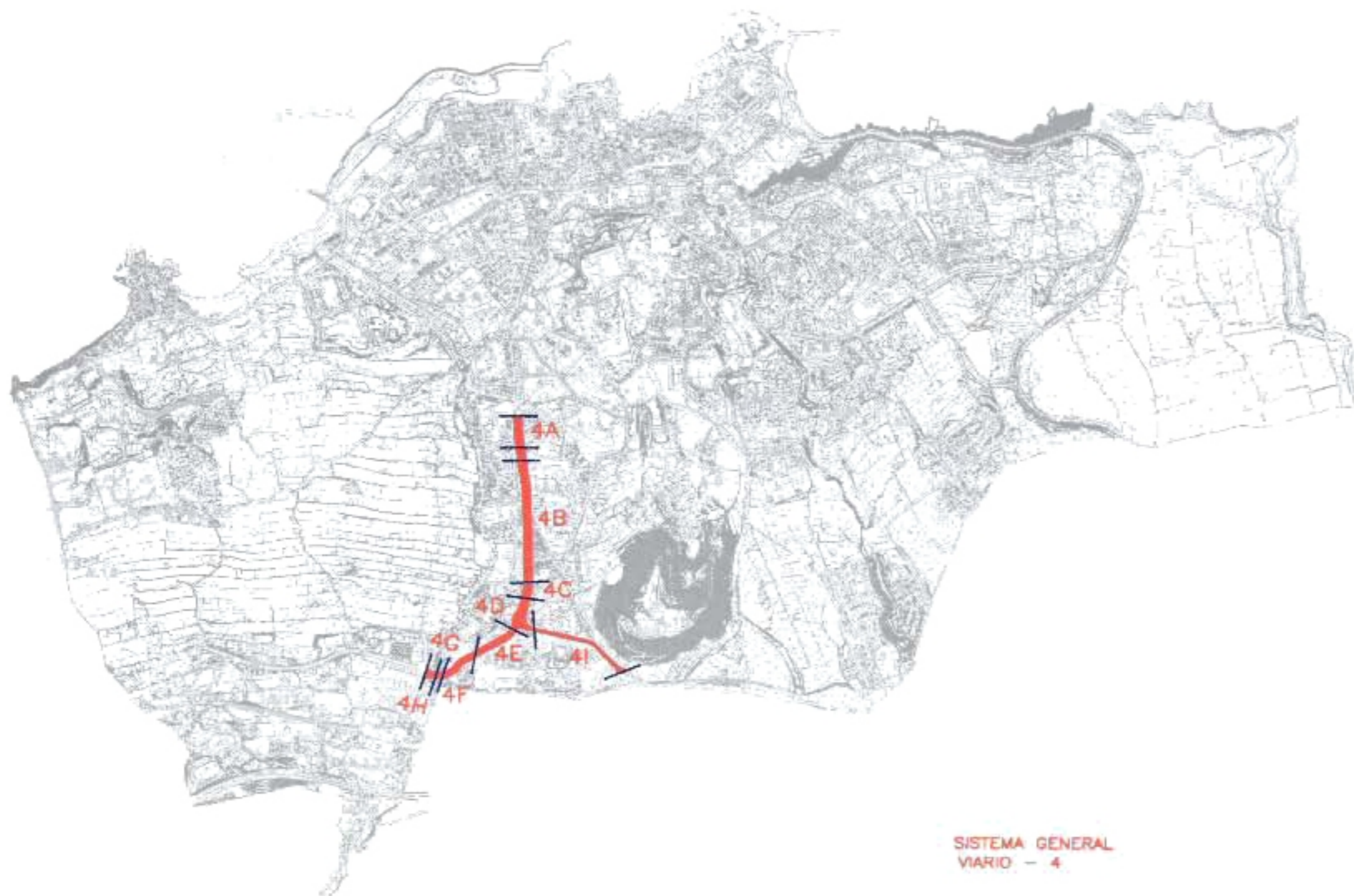
SISTEMA GENERAL VIARIO - 4

4F. —Suelo urbano de la A-12. Con diversas afecciones a edificaciones existentes.