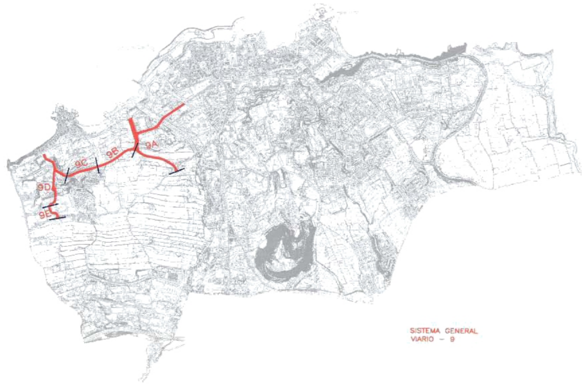
SISTEMA GENERAL VIARIO - 9