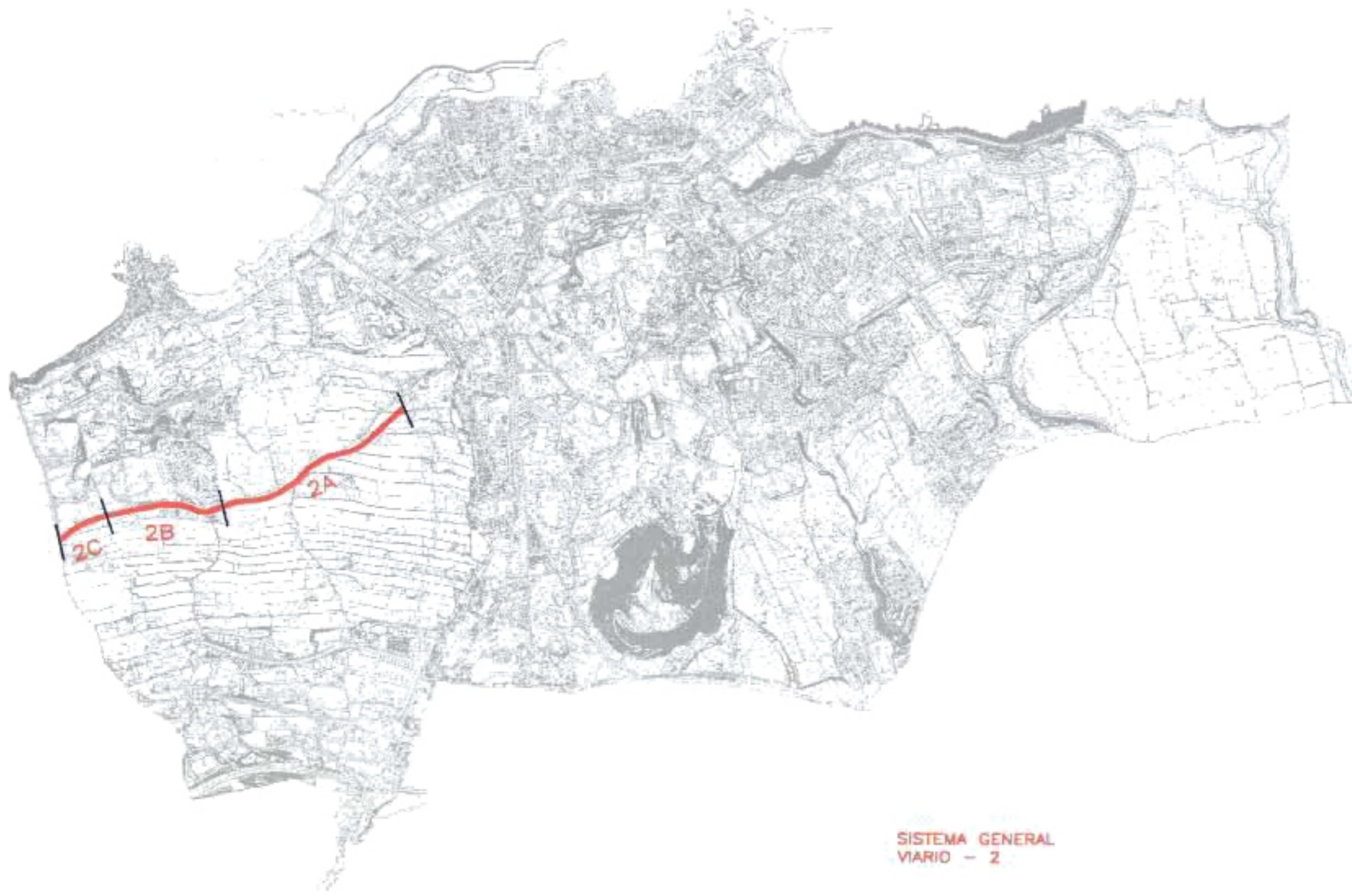
SISTEMA GENERAL VIARIO - 2

Las obras se ejecutarán por el Ayuntamiento, excepto en la zona 2B donde será a cargo de los propietarios del A-15.