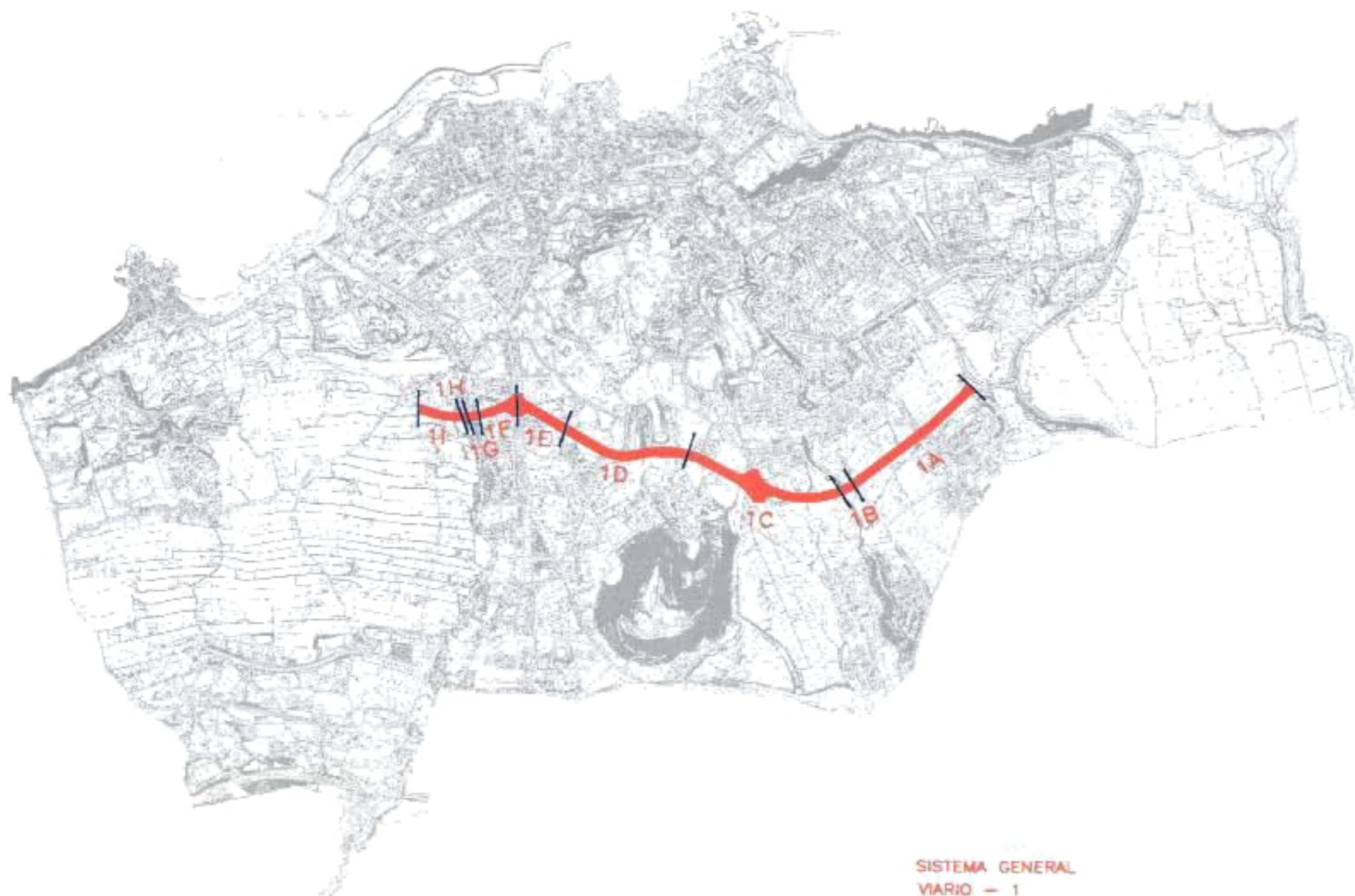
SISTEMA GENERAL VIARIO — 1

1I.-Suelo rústico de protección territorial