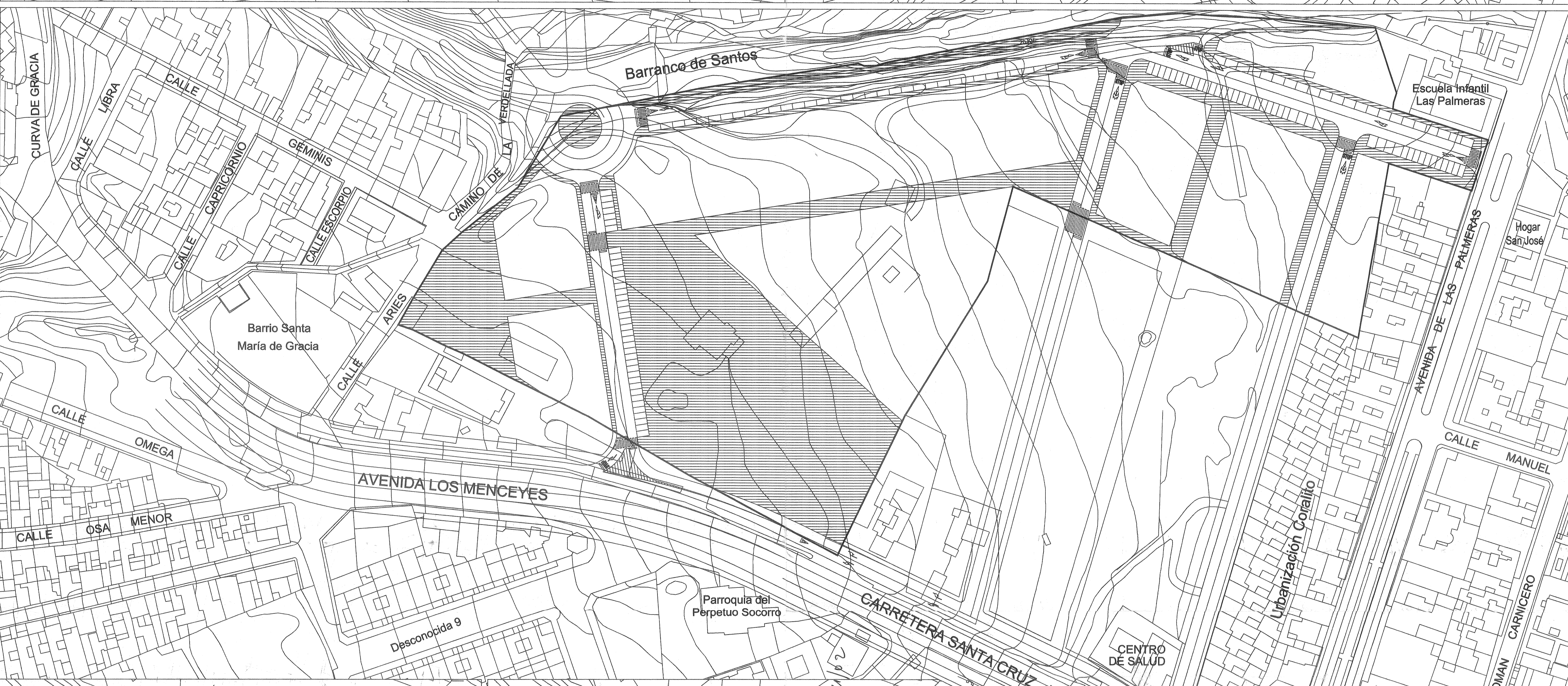
ACCESO A LA VERDELLADA FASE 1