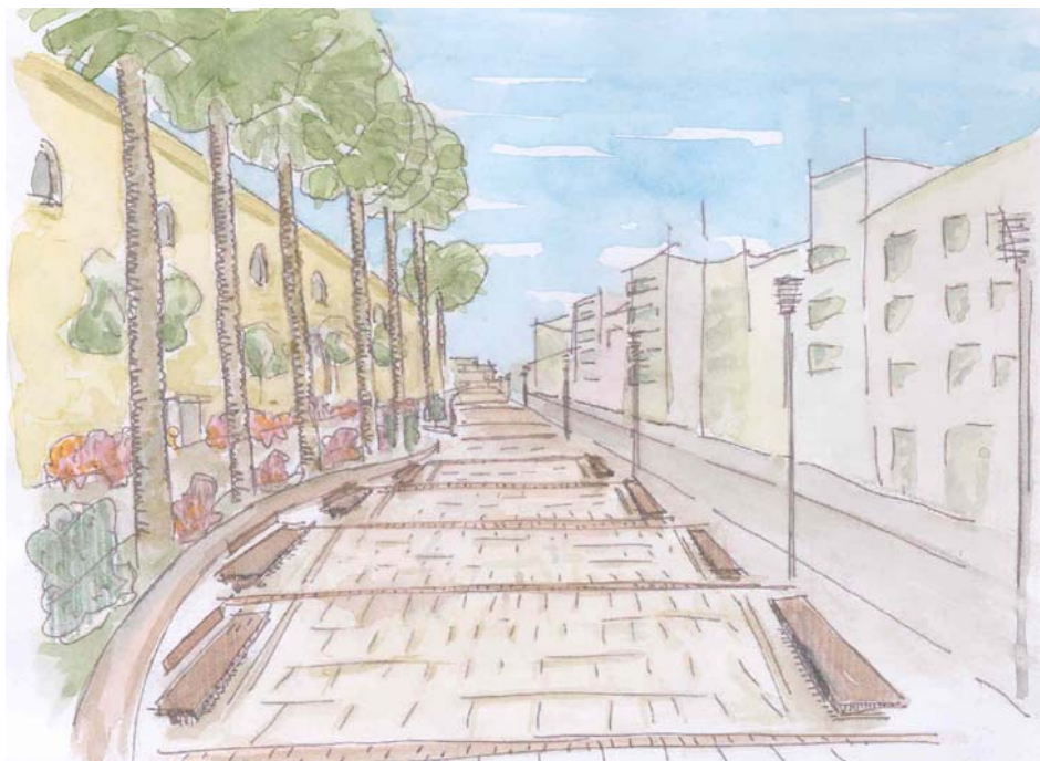
VISTA DE LA PLAZA DOCTOR OLIVERA