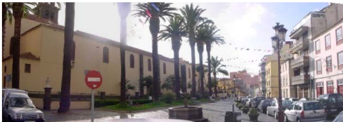
1 VISTA PANORÁMICA DE LA PLAZA DOCTOR OLIVERA