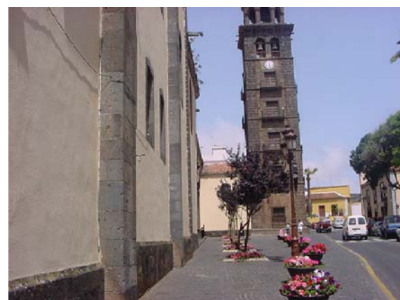
4 VISTA DE LA PLAZA DE LA CONCEPCIÓN