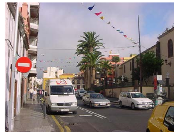
2 ZONA DE ESTACIONAMIENTO A LOS LADOS DE LA CALLE