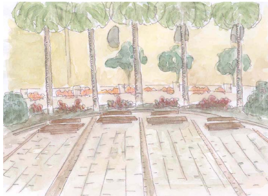
VISTA DE LA PLAZA DOCTOR OLIVERA