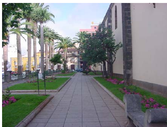
3 PLATAFORMA ELEVADA