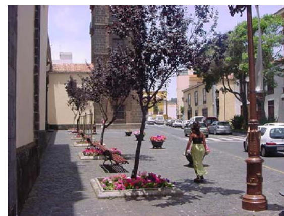
4 ALCORQUES Y MOBILIARIO URBANO

Documento de aprobación definitiva Julio 2005