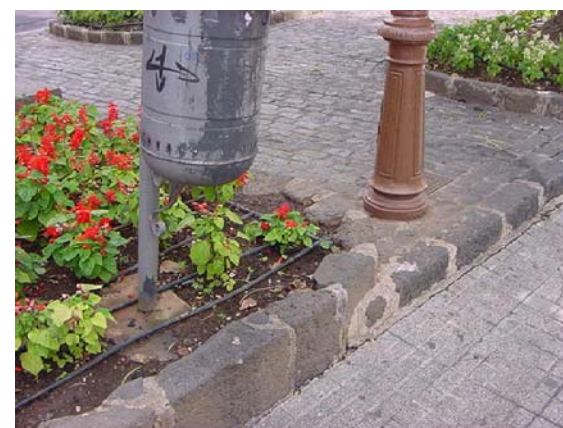
4 ALCORQUES Y PAVIMENTO DETERIORADOS