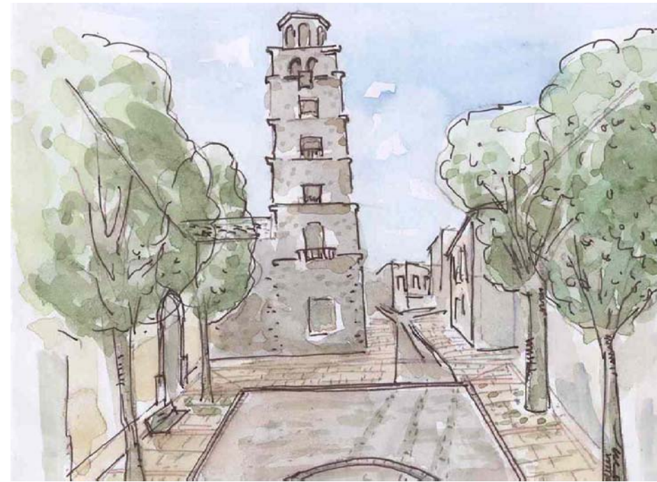
VISTA DE LA TORRE DESDE LA PLAZA DE LA CONCEPCIÓN