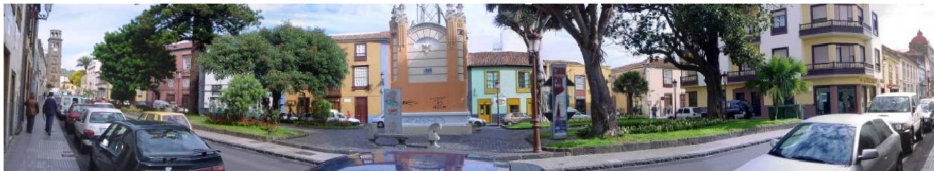
1 VISTA PANORÁMICA DE LA PLAZA DE LA CONCEPCIÓN