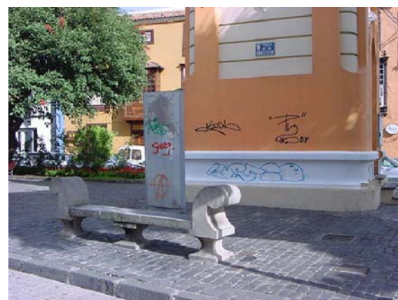
4 MOBILIARIO URBANO MAL UBICADO