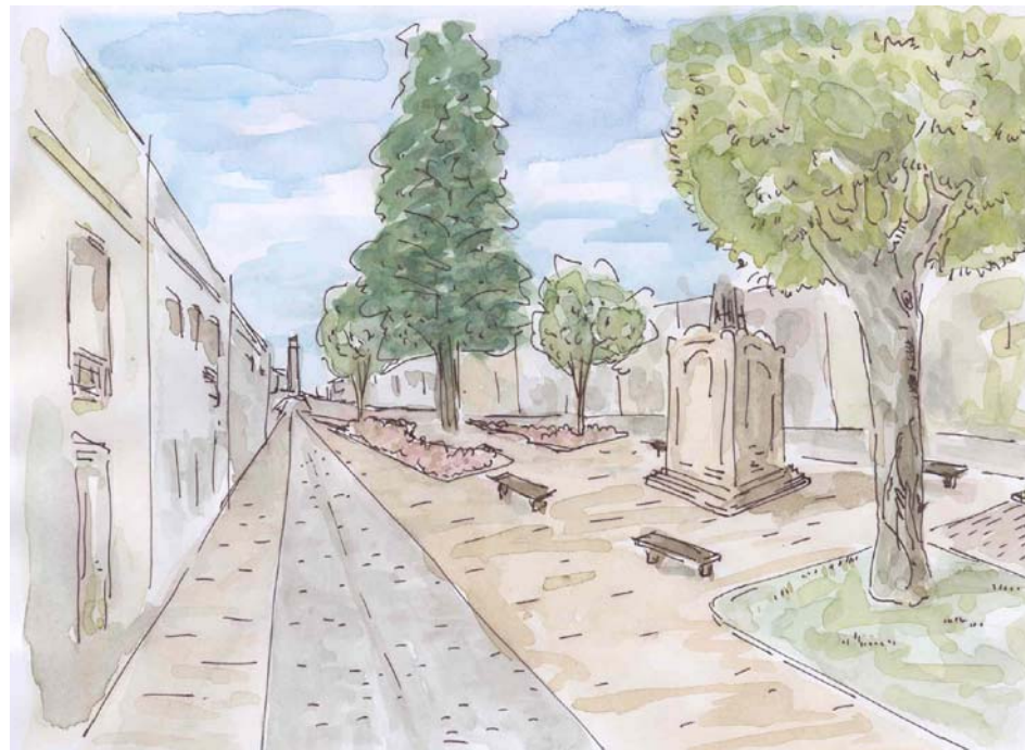
PLAZA DE LA CONCEPCIÓN