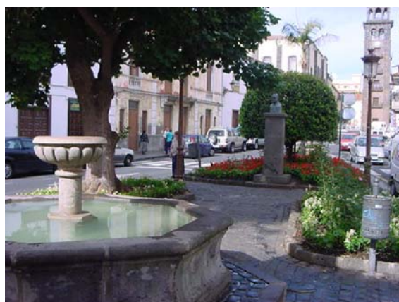
3 FUENTE Y VISTA HACIA LA CONCEPCIÓN