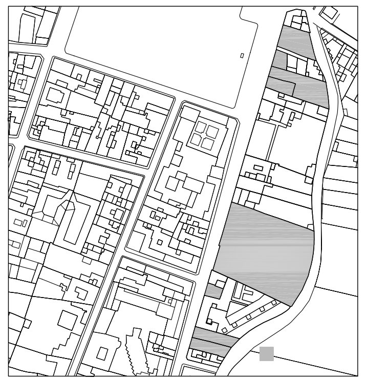
Delimitación de Parcelas - Mz 15259 ( Mz86)