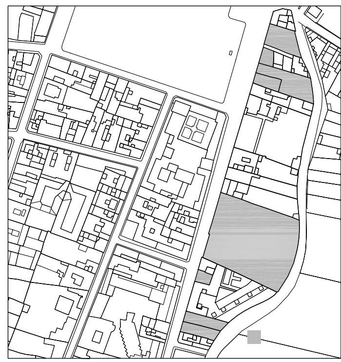
Delimitación de Parcelas - Mz 15259 ( Mz86)