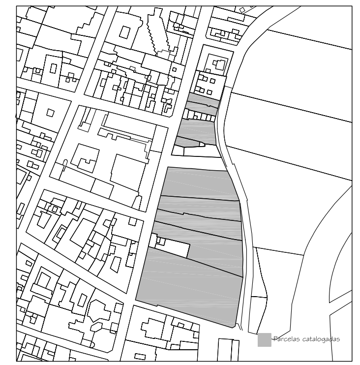
Delimitación de Parcelas - Mz 14219 ( Mz85)

ÁREA DE MOVIMIENTO Se permite IV plantas