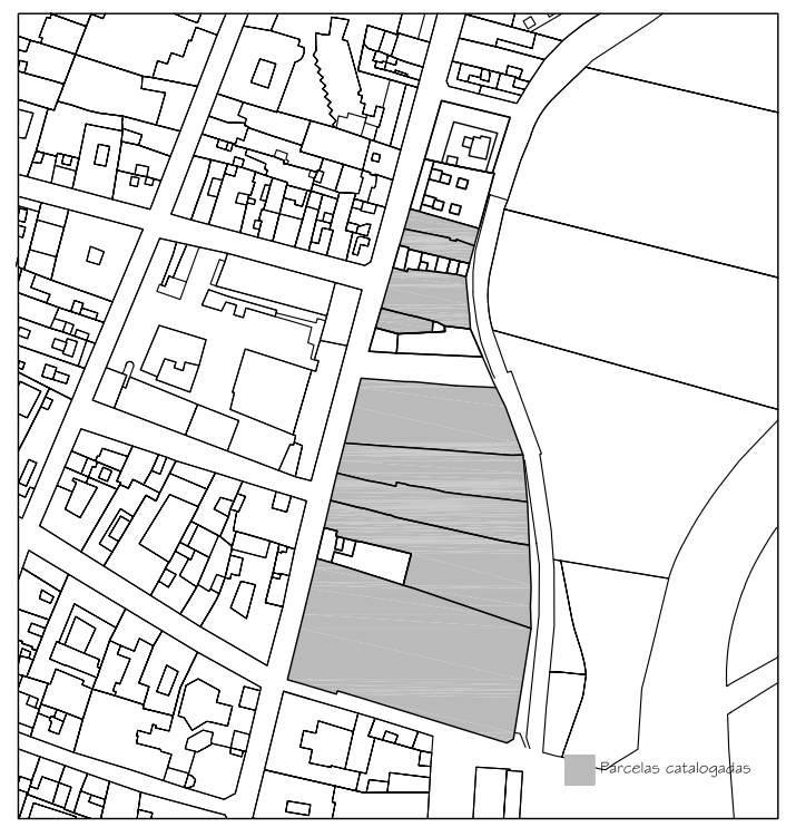
Delimitación de Parcelas - Mz 14219 ( Mz85)

ÁREA DE MOVIMIENTO Se permiten II plantas. Deberá respetar un área de libre del 30% de este sector