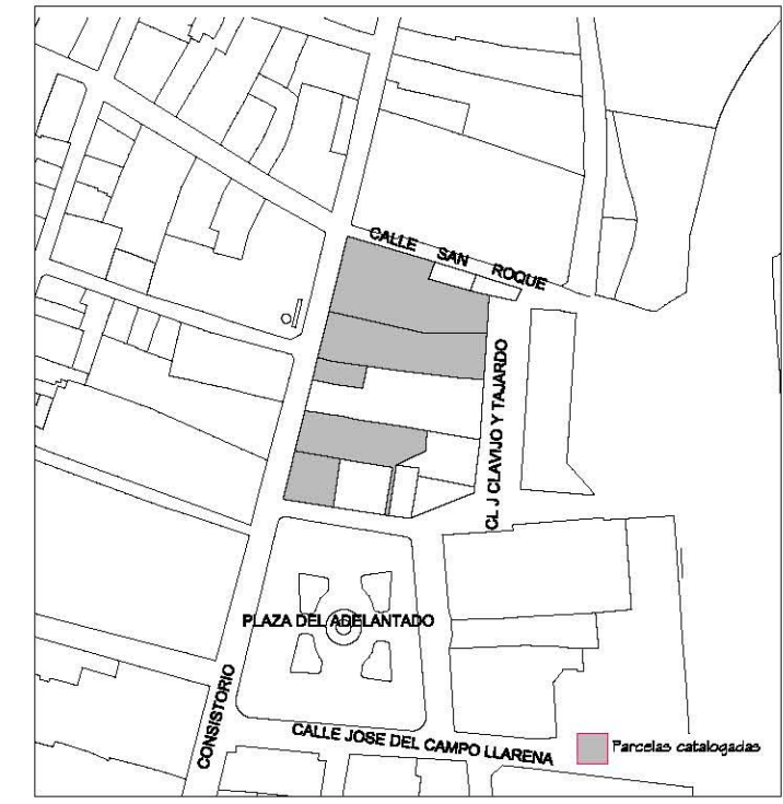
Delimitación de Parcelas - Mz 14208 (Mz84)