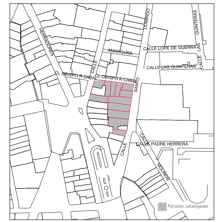
Delimitación de Parcelas - Mz 13179 (Mz81)

* EDIFICACIÓN NO CATALOGADA SERÁ DE APLICACIÓN LA ORDENANZA GENERAL. SE PERMITIRÁN: I PLANTA DE ALTURA. II PLANTAS DE ALTURAS. III PLANTAS DE ALTURAS. IV PLANTAS DE ALTURAS.