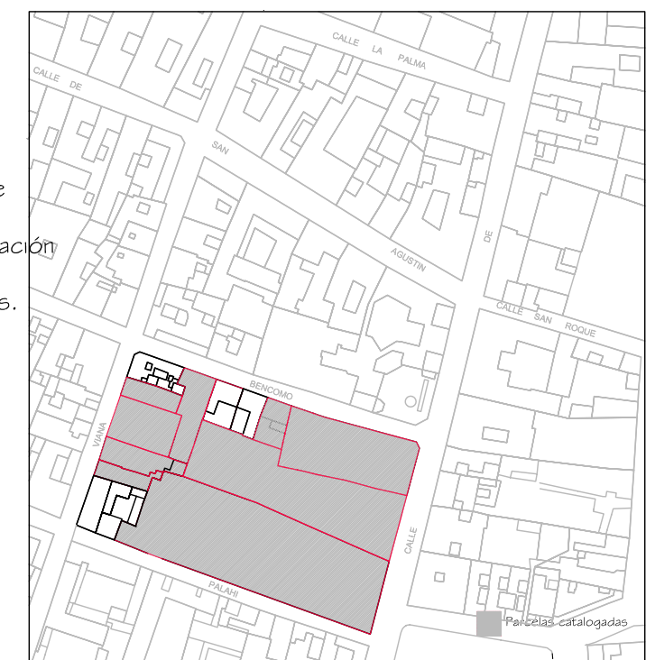
Delimitación de Parcelas - Mz 13208 (Mz75)