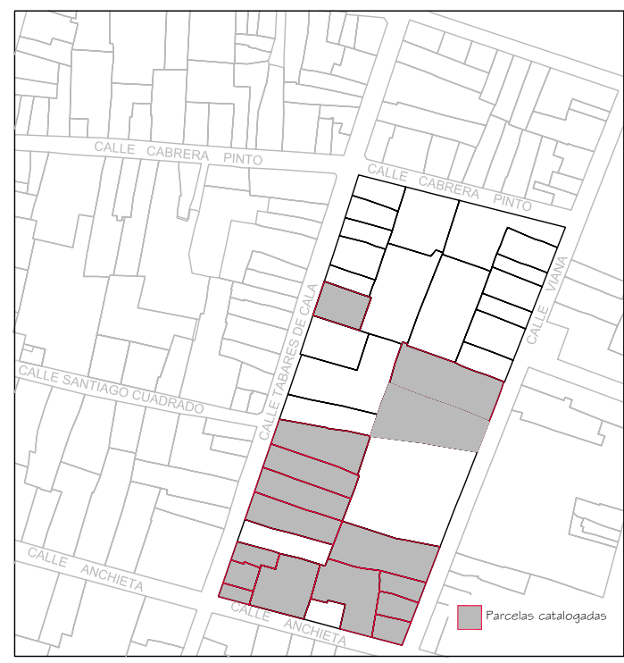
Delimitación de Parcelas - Mz 13239 ( Mz68)

• ORDENACIÓN SUSPENDIDA PENDIENTE DE INFORMACIÓN PÚBLICA