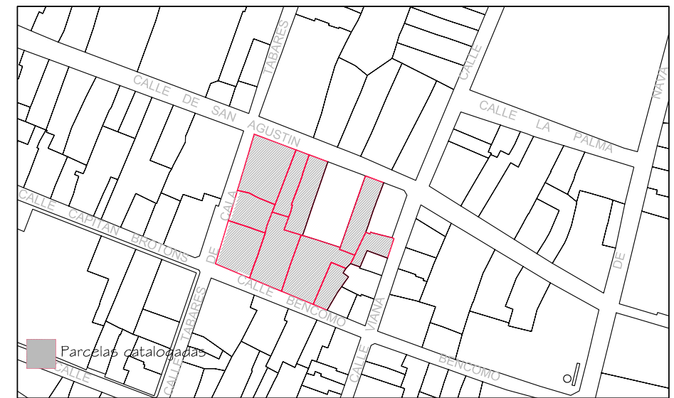
Delimitación de Parcelas - Mz 12203 (Mz66)

VER ÁMBITO DE ACTUACIÓN URBANÍSTICA Nº26