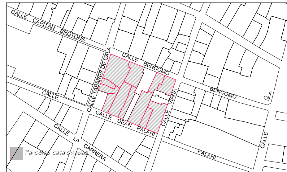
Delimitación de Parcelas - Mz 12209 ( Mz65)

ÁREA DE MOVIMIENTO De posible nueva edificación condicionada a inspección técnica y levantamiento del edificio existente.