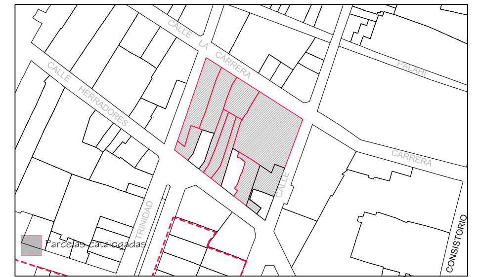
Delimitación de Parcelas - Mz 12198 ( Mz63)