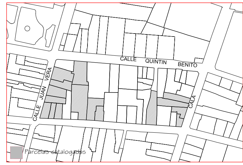
Delimitación de Parcelas - Mz 12246 (Mz60)

* EDIFICACIÓN NO CATALOGADA SERÁ DE APLICACIÓN LA ORDENANZA GENERAL. SE PERMITIRÁN: I PLANTAS DE ALTURA. II PLANTAS DE ALTURAS. III PLANTAS DE ALTURAS. IV PLANTAS DE ALTURAS.