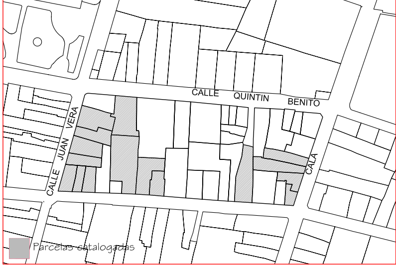
Delimitación de Parcelas - Mz 12246 (Mz60)

* EDIFICACIÓN NO CATALOGADA SERÁ DE APLICACIÓN LA ORDENANZA GENERAL. SE PERMITIRÁN: I PLANTAS DE ALTURA. II PLANTAS DE ALTURAS. III PLANTAS DE ALTURAS. IV PLANTAS DE ALTURAS.