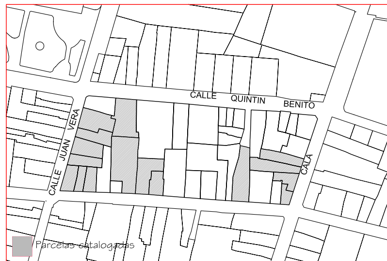
Delimitación de Parcelas - Mz 12246 (Mz60)

* EDIFICACIÓN NO CATALOGADA SERÁ DE APLICACIÓN LA ORDENANZA GENERAL. SE PERMITIRÁN: I PLANTAS DE ALTURA. II PLANTAS DE ALTURAS. III PLANTAS DE ALTURAS. IV PLANTAS DE ALTURAS.