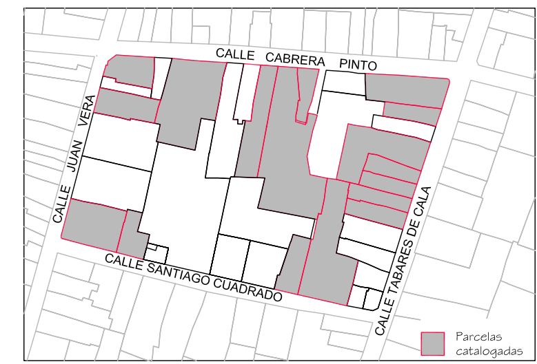
Delimitación de Parcelas - Mz 12223 (Mz 59)

Eliminar una planta para adecuarse a la normativa de altura máxima permitida colindante con edificios catalogados. Altura permitida II plantas.