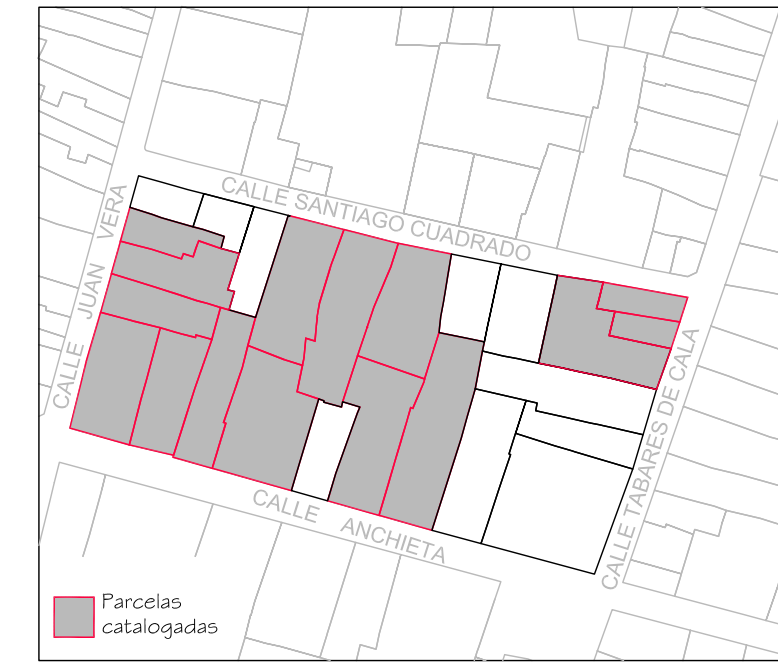
Delimitación de Parcelas - Mz 12222 (Mz 58)

ORDENACIÓN SUSPENDIDA PENDIENTE DE INFORMACIÓN PÚBLICA * EDIFICACIÓN NO CATALOGADA SERÁ DE APLICACIÓN LA ORDENANZA GENERAL. SE PERMITIRÁN: I PLANTAS DE ALTURA. II PLANTAS DE ALTURAS. III PLANTAS DE ALTURAS. IV PLANTAS DE ALTURAS.