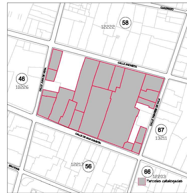
Delimitación de Parcelas - Mz 12227 ( Mz57)