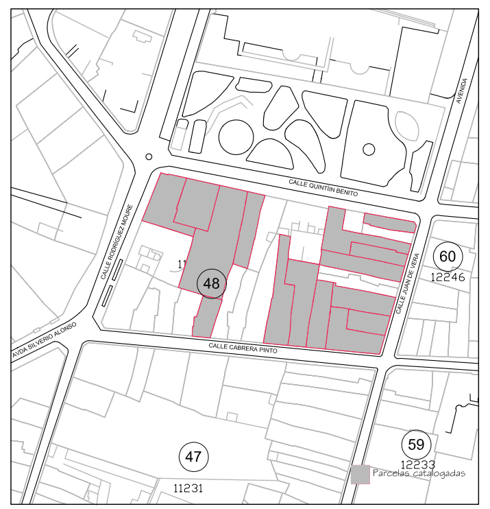
Delimitación de Parcelas - Mz 11257 (Mz48)