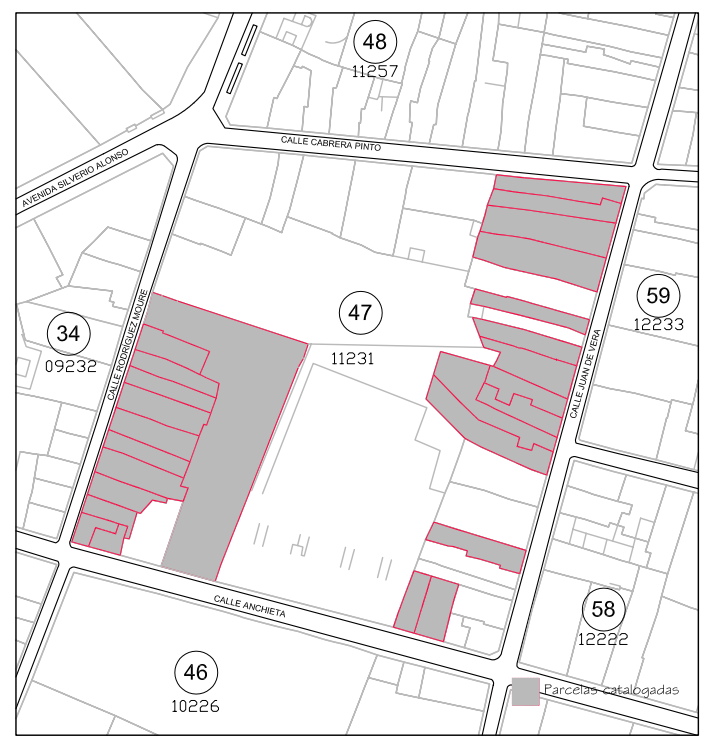
Delimitación de Parcelas - Mz 11231 (Mz47)