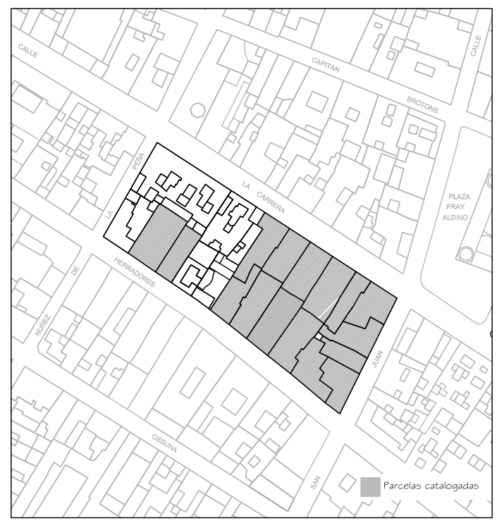
Delimitación de Parcelas - Mz 10205 (Mz43)

* EDIFICACIÓN NO CATALOGADA SERÁ DE APLICACIÓN LA ORDENANZA GENERAL. SE PERMITIRÁN: I PLANTAS DE ALTURAS. II PLANTAS DE ALTURAS. III PLANTAS DE ALTURAS. IV PLANTAS DE ALTURAS.