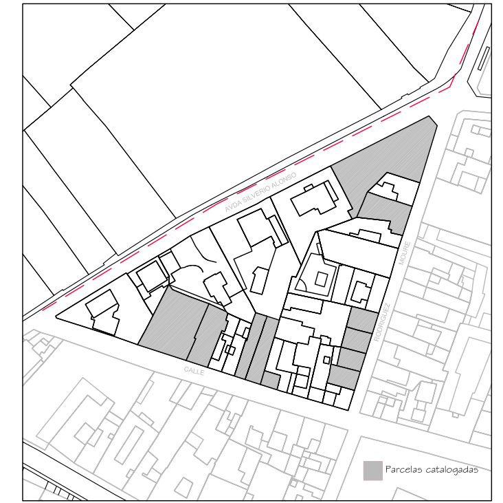
Delimitación de Parcelas - Mz 09232 ( Mz34)

EDIFICACIÓN NO CATALOGADA SERÁ DE APLICACIÓN LA ORDENANZA GENERAL. SE PERMITIRÁN: I PLANTAS DE ALTURAS. II PLANTAS DE ALTURAS. III PLANTAS DE ALTURAS. IV PLANTAS DE ALTURAS.