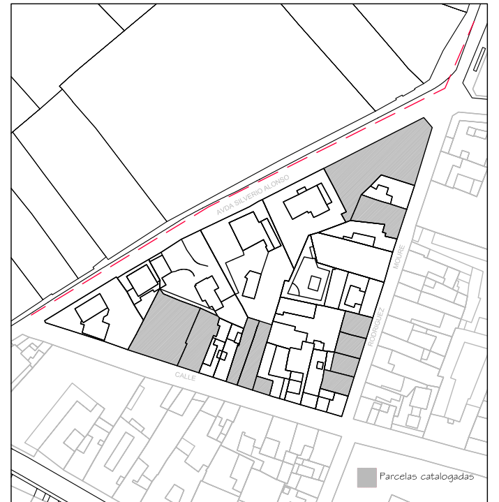
Delimitación de Parcelas - Mz 09232 ( Mz34)

EDIFICACIÓN NO CATALOGADA SERÁ DE APLICACIÓN LA ORDENANZA GENERAL. SE PERMITIRÁN: I PLANTAS DE ALTURAS. II PLANTAS DE ALTURAS. III PLANTAS DE ALTURAS. IV PLANTAS DE ALTURAS.