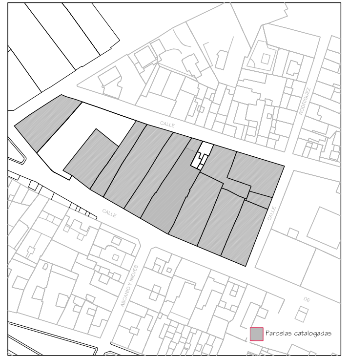
Delimitación de Parcelas - Mz 09238 ( Mz33)