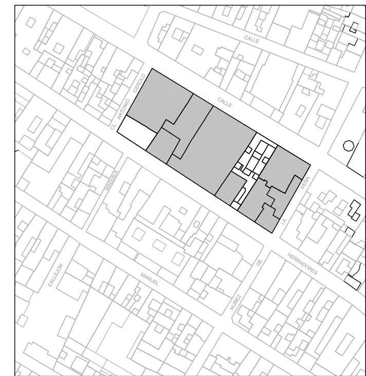
Delimitación de Parcelas - Mz 09218 ( Mz30)

EDIFICACIÓN NO CATALOGADA SERÁ DE APLICACIÓN LA ORDENANZA GENERAL. SE PERMITIRÁN: I PLANTAS DE ALTURAS. II PLANTAS DE ALTURAS. III PLANTAS DE ALTURAS. IV PLANTAS DE ALTURAS.