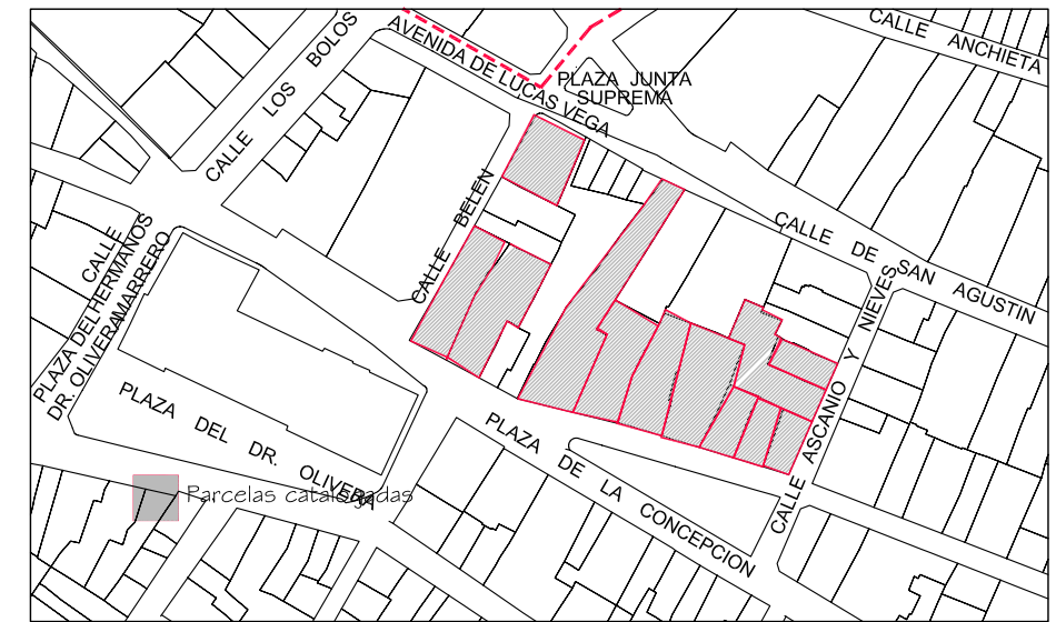
Delimitación de Parcelas - Mz 08225 ( Mz27)