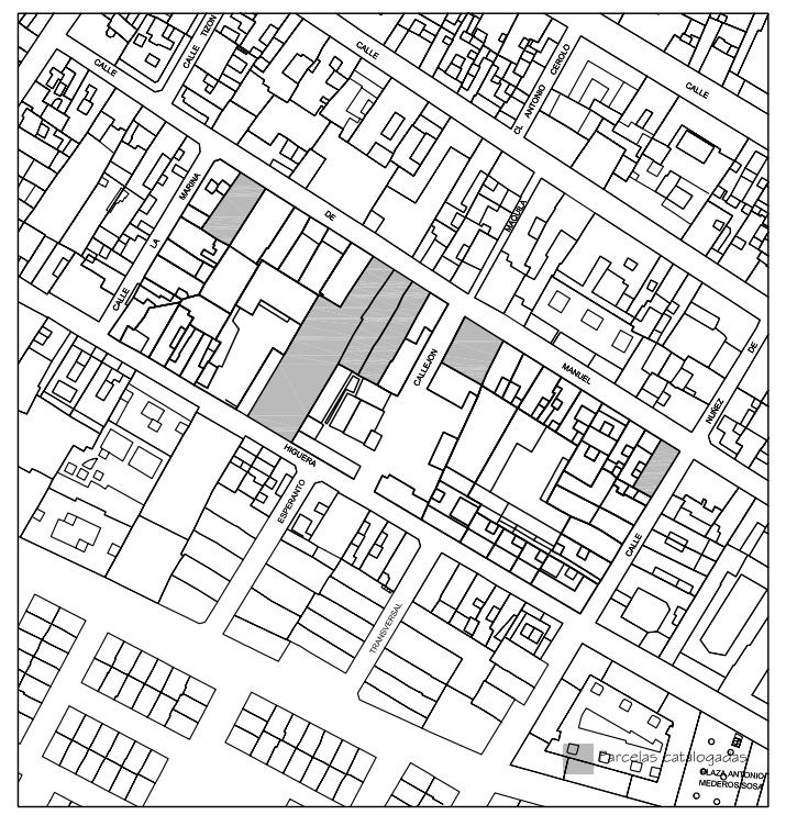
Delimitación de Parcelas - Mz 08209 ( Mz24)

ÁREA DE MOVIMIENTO De 2 plantas Incorporando la segunda tras la fachada actual, sin manifestarse a la calle con ventanas velux en cubierta