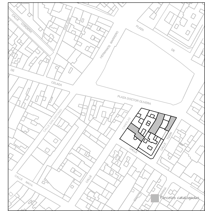
Delimitación de Parcelas - Mz 07212 ( Mz20)

* EDIFICACIÓN NO CATALOGADA SERÁ DE APLICACIÓN LA ORDENANZA GENERAL. SE PERMITIRÁN: I PLANTAS DE ALTURA. II PLANTAS DE ALTURAS. III PLANTAS DE ALTURAS. IV PLANTAS DE ALTURAS.