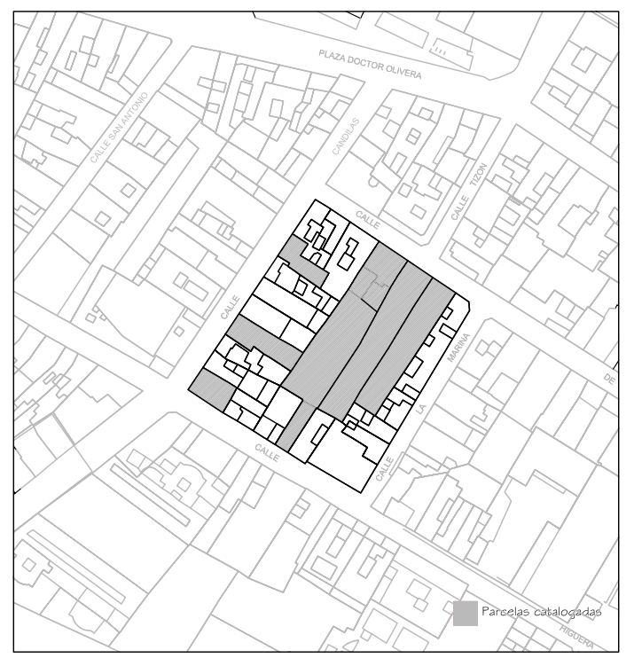
Delimitación de Parcelas - Mz 07218 ( Mz19)