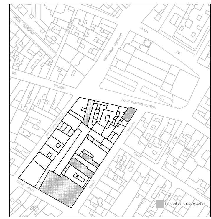
Delimitación de Parcelas - Mz 06216 ( Mz 14 )

ÁREA DE PROTECCIÓN Se protege desde las estructuras hasta los acabados.