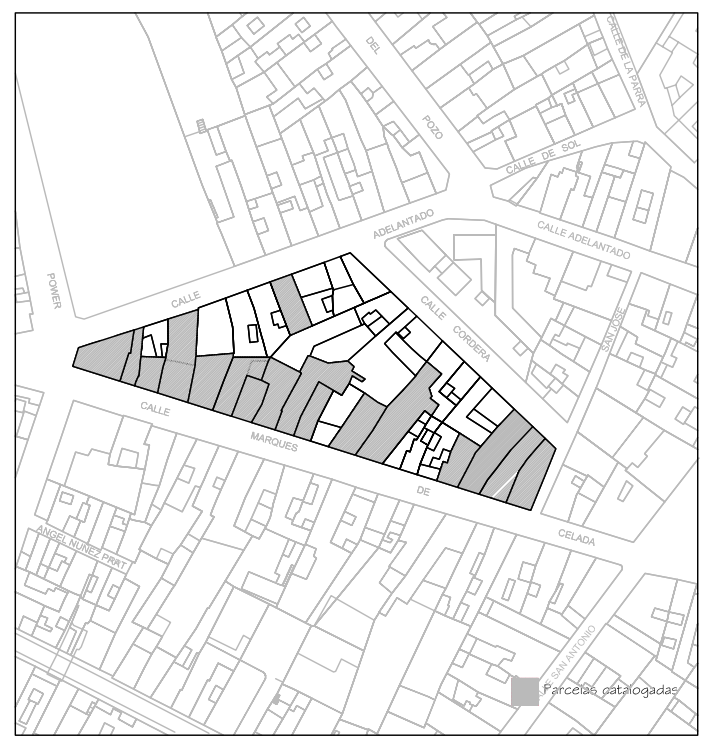
Delimitación de Parcelas - Mz 06221 ( Mz10)

* EDIFICACIÓN NO CATALOGADA SERÁ DE APLICACIÓN LA ORDENANZA GENERAL. SE PERMITIRÁN: I PLANTAS DE ALTURA. II PLANTAS DE ALTURAS. III PLANTAS DE ALTURAS. IV PLANTAS DE ALTURAS.