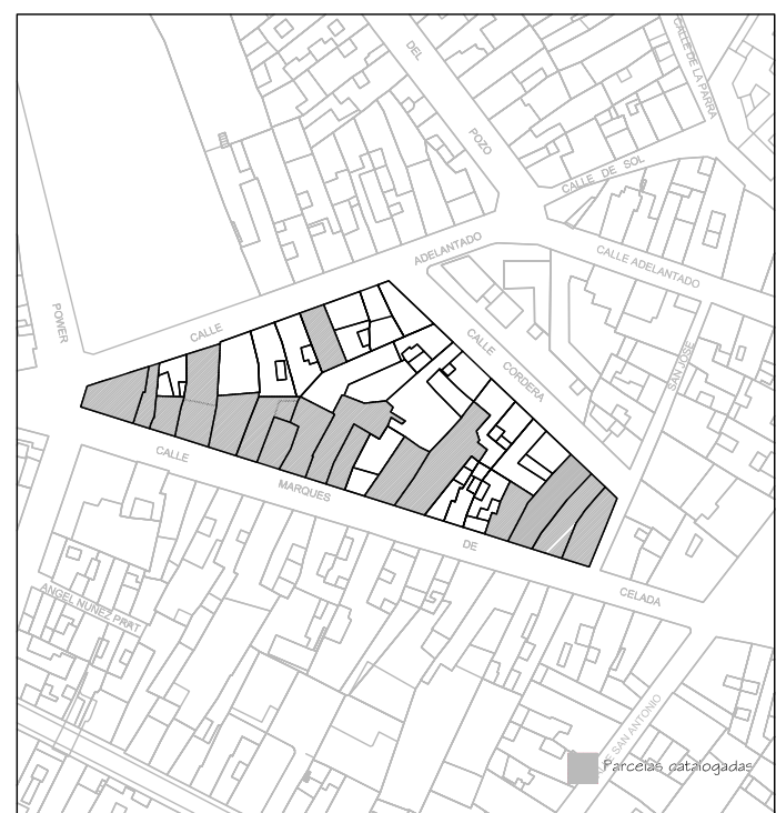
Delimitación de Parcelas - Mz 06221 ( Mz10)