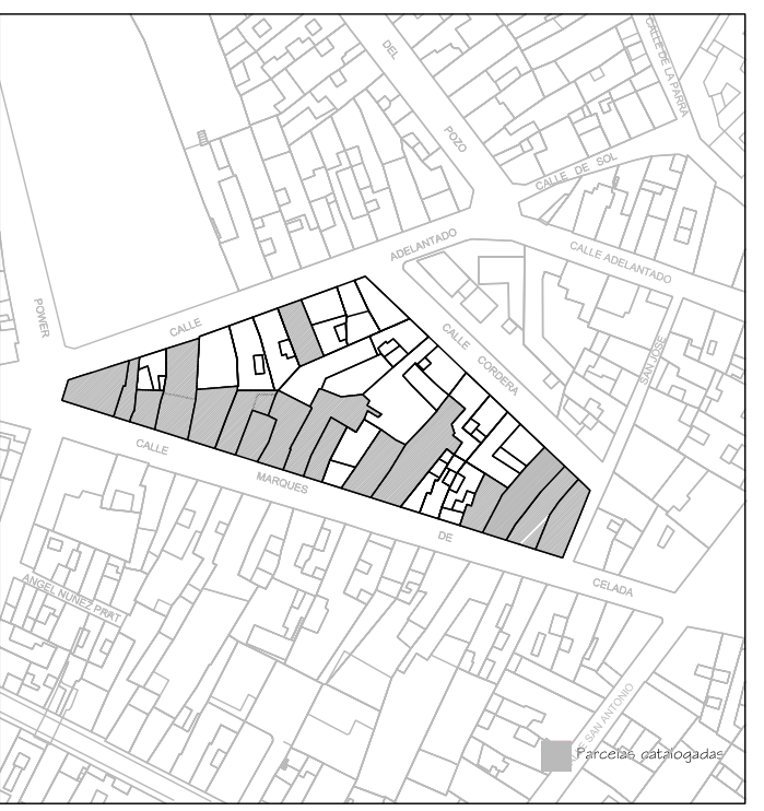
Delimitación de Parcelas - Mz 06221 ( Mz10)

ÁREA DE MOVIMIENTO 2 Plantas ÁREA LIBRE OBLIGATORIA