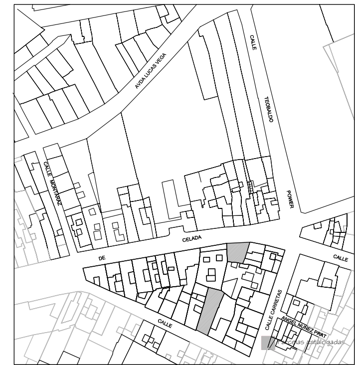
Delimitación de Parcelas - Mz 04225 ( Mz06)