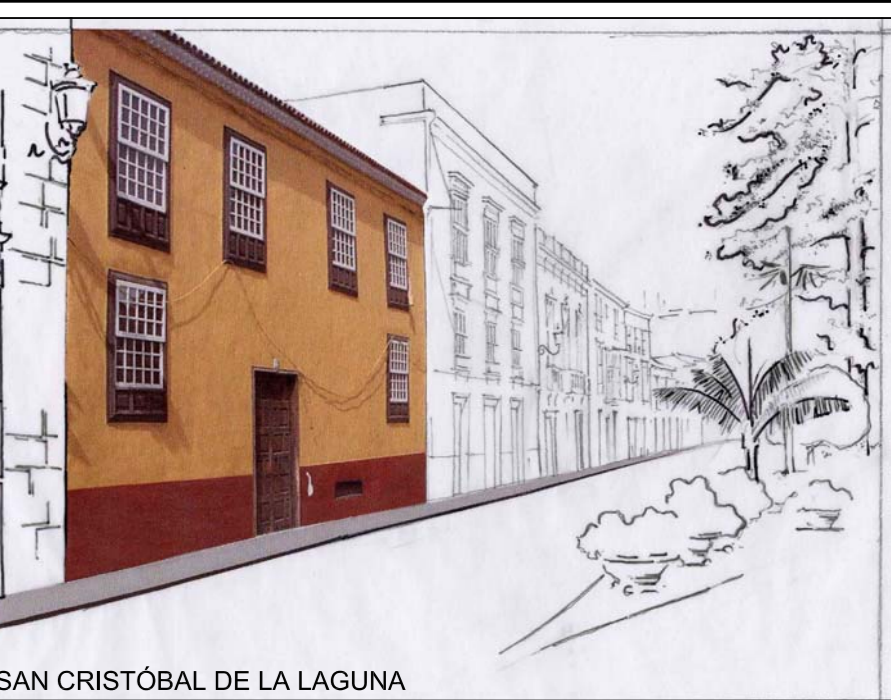
SAN CRISTÓBAL DE LA LAGUNA