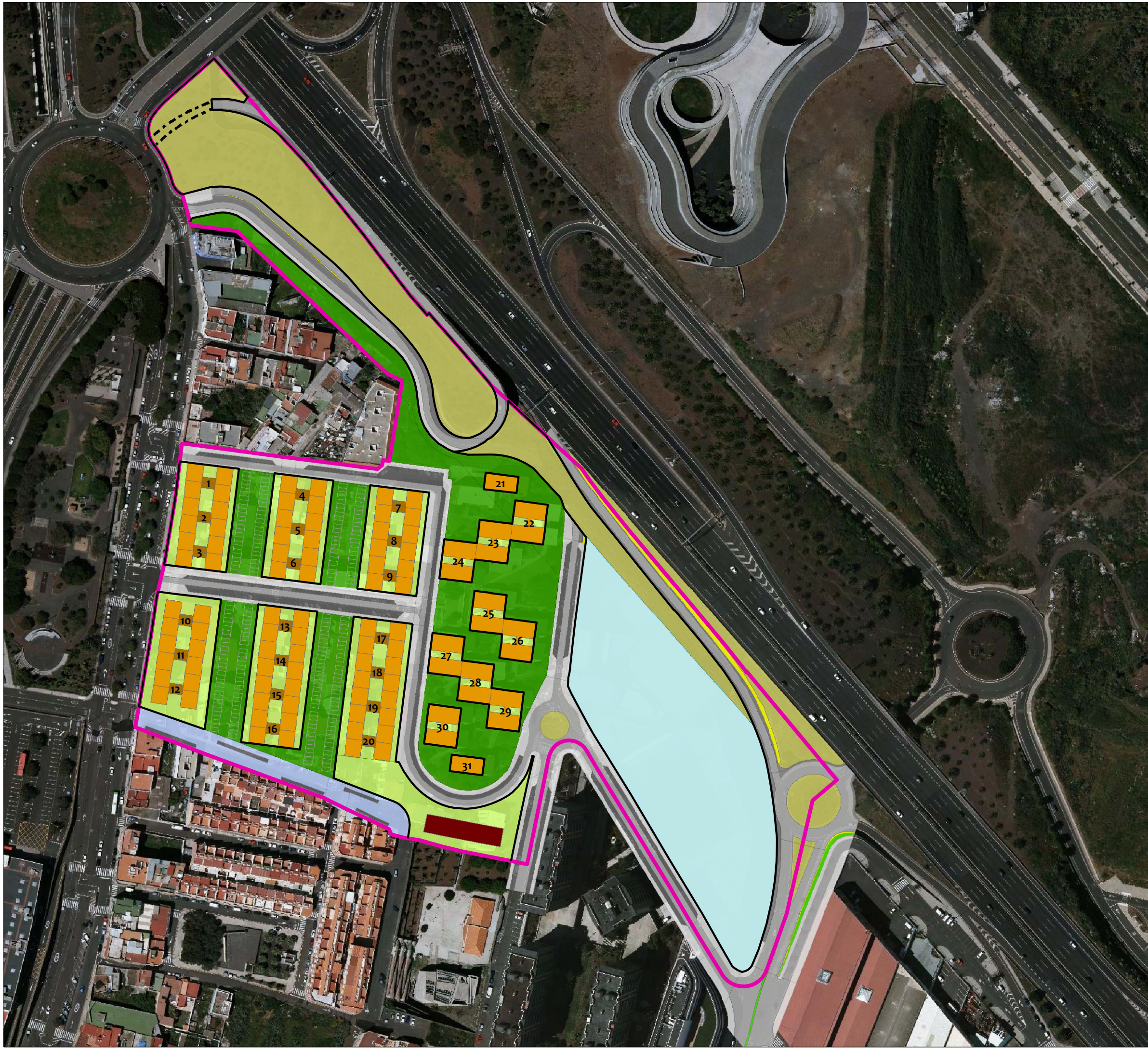
IMAGEN DE LA EDIFICACIÓN