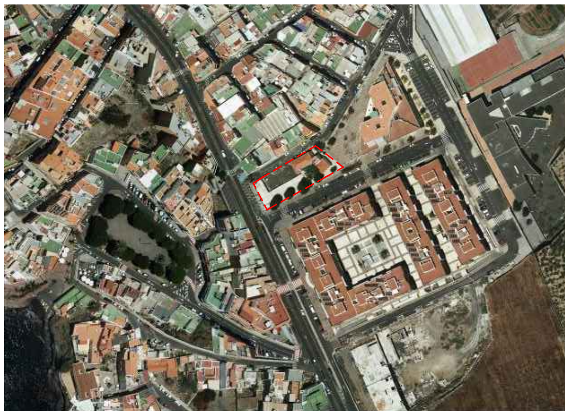
* FOTO AÉREA